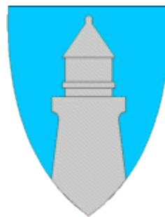
Lindesnes kommune er på 316,58 km 2 og har 4.616 innbyggere

Kommunene er kupert med med sørlandske knauser og berg. Løsmassene-avsetningene er stort sett å finne i elvedalene. I Mandal finner man god og flat jordbruksmark langs Mandalselva blant annet i Holum, og i tillegg på Imesletta og litt ved Valand – Harkmarks- området. I Lindesnes er det flott jordbruksmark langs Audnaelva blant annet i Vigmostad, Buhølen, Vallemoen, Hommesletta og Rødberg. I tillegg på Underøy og Gare i Spangereid.